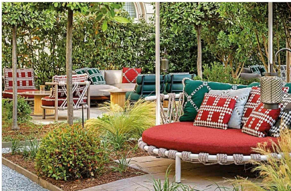
● Nella foto, il giardino del Four Seasons Milano , nel cuore della città. L'hotel accoglie pets, come quello di Firenze, che prepara per loro uno menu con filetto . La tariffa di 250 euro a notte prevede anche le attenzioni del personale.

A mati, viziati, quasi umanizzati. È così che gli animali domestici non solo sono diventati membri ufficiali della famiglia, ma oggi muovono un mercato da 6,8 miliardi di euro di spesa stando all'ultimo rapporto Coop Nomisma. Questioni di cuore, moltissimo anche di numeri visto che in Italia ci sono 65 milioni di pet , con cani e gatti che arrivano ai 19 milioni (8,8 milioni di cani e 10,2 milioni di gatti): nel 2023, quasi 1 persona su 5 li ha portati con sé in vacanza, tanto che nei prossimi 10 anni si stima una crescita del turismo pet friendly del 124 per cento. Il che ha provocato un'ondata di servizi sempre più sofisticati, con welcome kit e gadget di lusso sartoriali, rifugi di charme e sfarzosi palazzi storici pronti a ridefinire il concetto di Vip trasformandolo in "Very Important Pet".