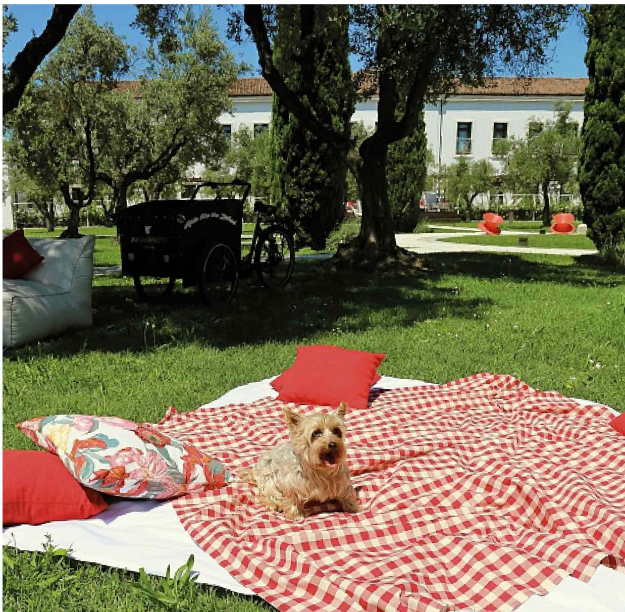
● Nella foto, gli hotel Mariott , come The St Regis Venice , qui sopra, accolgono pets in alberghi storici e nei loro giardini.

esclusivi per scoprire gli angoli più pet friendly della città e un collare corredato da una medaglietta incisa con il loro nome: il souvenir da portare a casa.