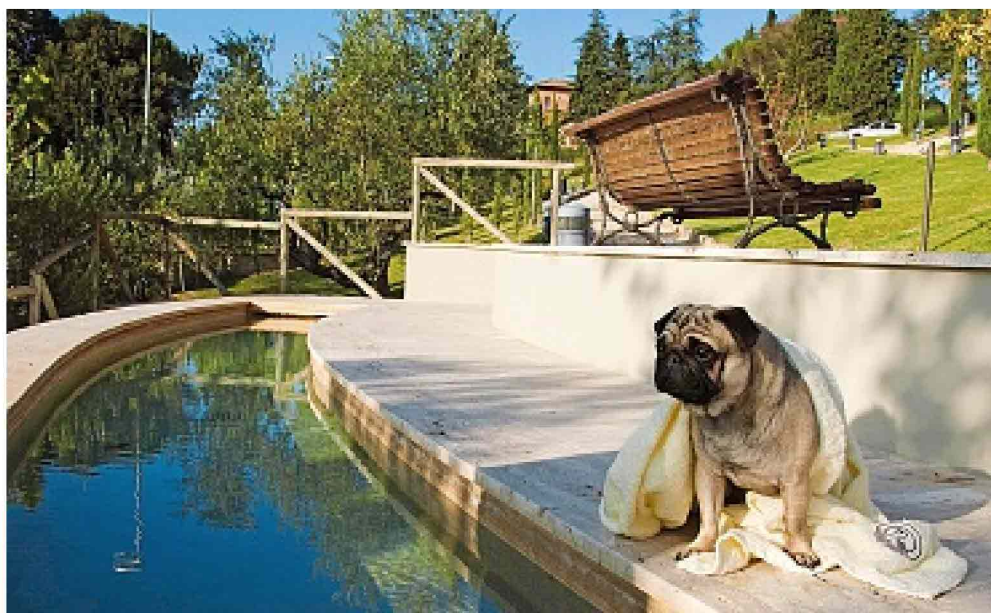
● Sopra, la Dog label nelle stanze che accolgono pet al Fonteverde Terme & Hotel di San Casciano dei Bagni e un Carlino nella dog swimming pool.