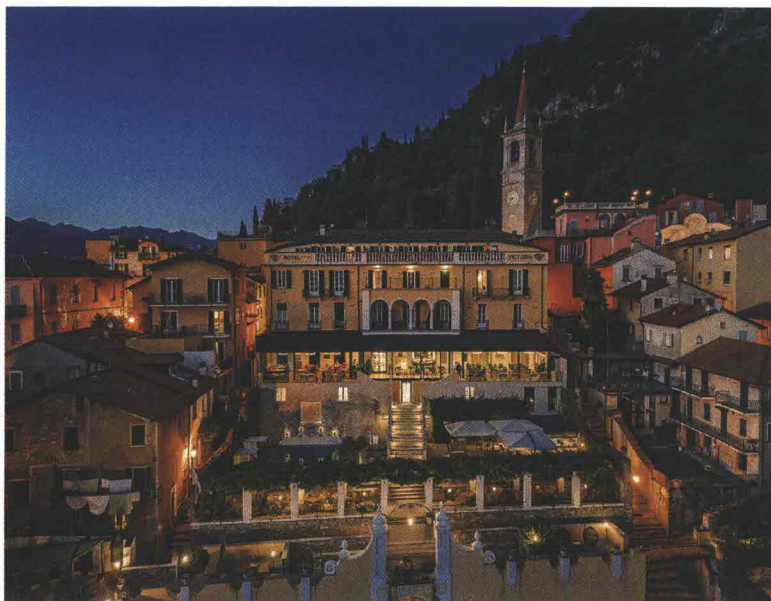
Royal Victoria, Varenna

E, se è vero che le due strutture hanno un porticciolo privato per chi volesse proprio arrivare via Lago, è altrettanto vero che c'è una grande costanza in chi questi sceglie di visitare questi luoghi. "I nostri ospiti non sono semplici turisti ma veri e propri cercatori di bellezza. Una bellezza che oggi è traducibile con luoghi e panorami instagrammabili come dimostrano i nostri tanti follower sui social".