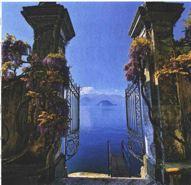
Villa Cipressi, iconico cancello sul lago