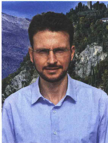
Mauro Manzoni, sindaco di Varenna

Splendido borgo sul ramo lecchese del Lago di Lario, Varenna è riconosciuta come il "diamante del Lago di Como". Oggi, da piccolo centro di pescatori, si conferma una cittadina suggestiva, avvalorata da molte strutture in stile lombardo, palazzi e antiche chiese. Con circa 800 abitanti, Varenna consente itinerari tra storia e arte. Per il soggiorno, tante le opzioni disponibili: dal borgo alla zona collinare si può scegliere tra alberghi e b&b, ma anche design studio, case vacanza e dimore storiche.