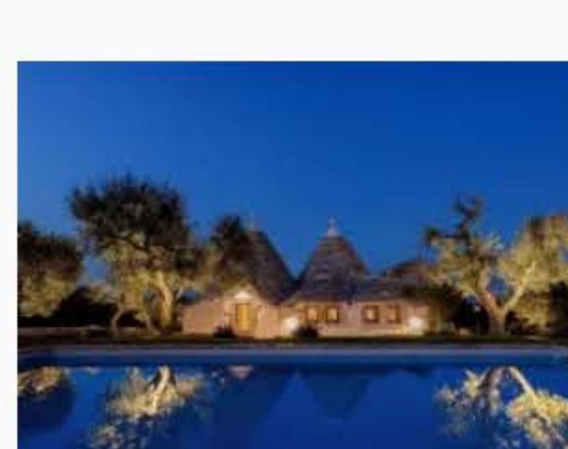
Puglia Paradise: ospitalità di lusso nel cuore della Puglia 10 Maggio 2024