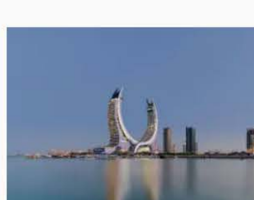
Fairmont Doha 8 Maggio 2024