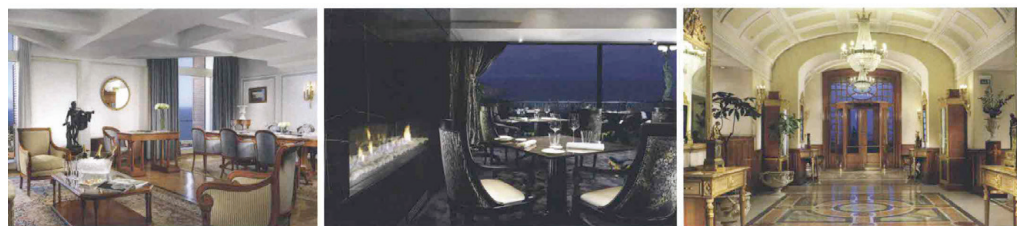
A sinistra Vista del golfo di Napoli dalla terrazza del Grand Hotel Parker's. Sopra Immagini degli interni

GRAND HOTEL PARKER'S Corso Vittorio Emanuele 135, Napoli www.grandhotelparkers.it