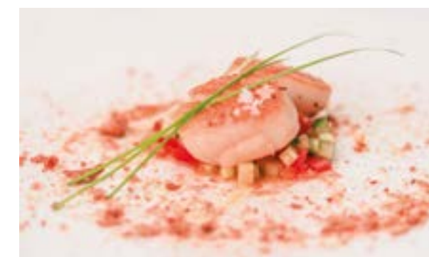
Da sinistra Un dettaglio esterno. Capasanta, crumble di tarallo al limone, pomodoro pachino e cetriolo.