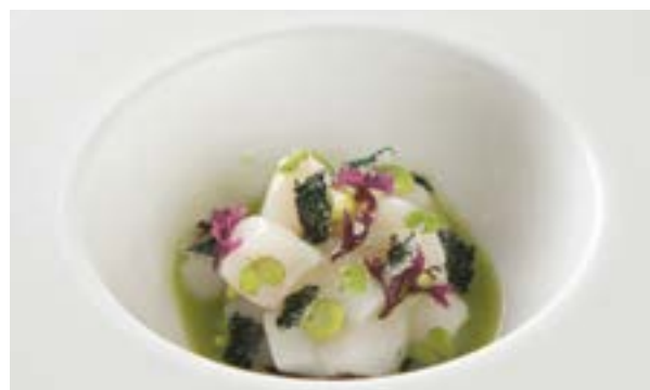
Da sinistra un dettaglio del Ristorante Cielo, la Capasanta.