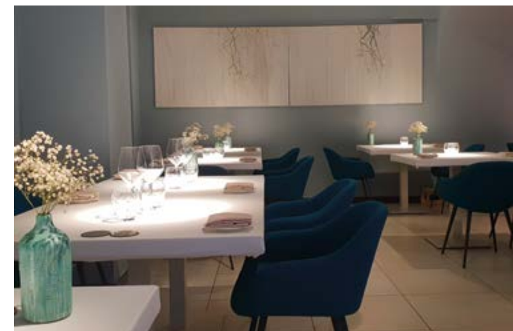
In alto Ostriche, citronette, ciliegia e fiori eduli. Sopra Lattuga, peperone crusco, olive nere. A destra la sala di Quintessenza Restaurant.